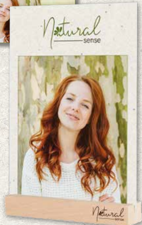
Aufsteller DIN A4