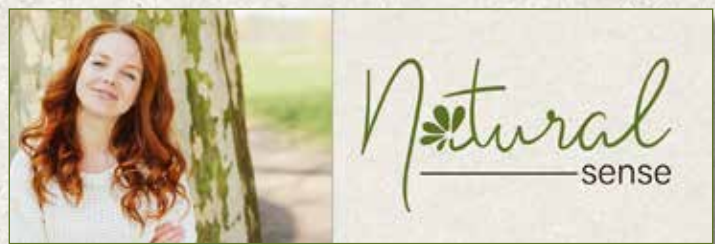
Homepage Banner 1920 x 640px